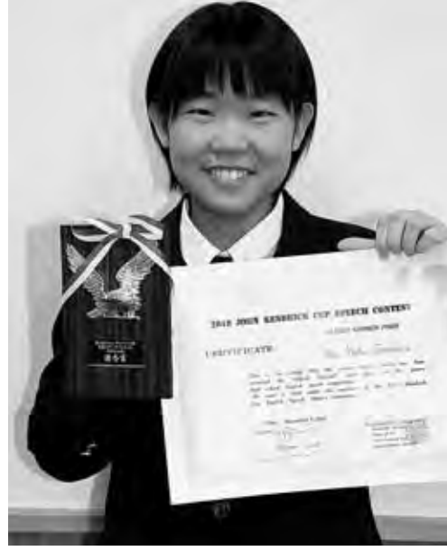
和歌山市でこのほど開かれた「第25回ジョン・ケン... 実行委員会主催。郷土に誇りを持ち、世界に目を向けて英語を学ぶ意欲を育てようとする...

「食」が地域に持続可能な経済を生む... 「食のテキスト」作りを勧める「地域の食をブランドにする！」